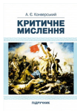
Критичне мислення. Підручник