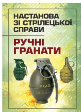
Настанова зі стрілецької справи. Ручні гранати