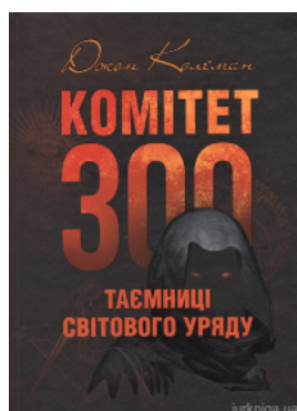
Комітет 300. Таємниці світового уряду