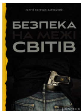
Безпека на межі світів