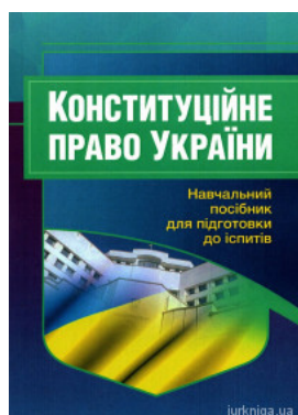
Конституційне право України. Навчальний посібник для підготовки до іспитів