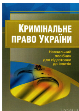
Кримінальне право України. Навчальний посібник для підготовки до іспитів