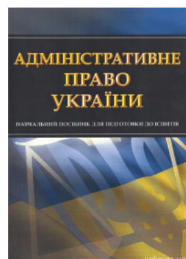
Адміністративне право України. Навчальний посібник для підготовки до іспитів