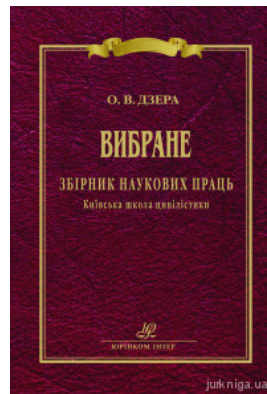
Дзера О. В. Вибране. Збірник наукових праць. Київська школа цивілістики