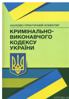
Науково-практичний коментар Кримінально-виконавчого кодексу України