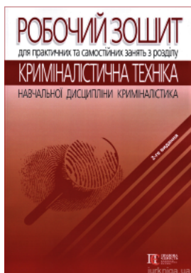
Робочий зошит для практичних та самостійних занять з розділу «Криміналістична техніка» навчальної дисципліни «Криміналістика»