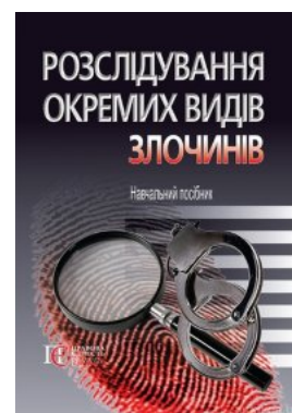
Розслідування окремих видів злочинів. Навчальний посібник