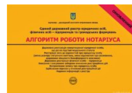
Єдиний державний реєстр юридичних осіб, фізичних осіб-підприємців та громадських формувань. Алгоритм роботи нотаріуса

Перейти до галузі права Цивільне право та процес