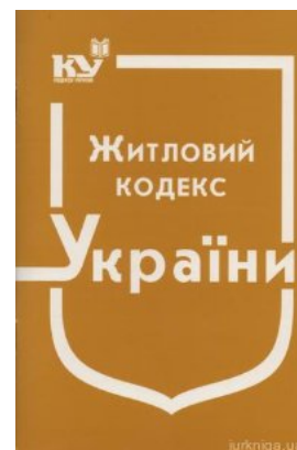
Житловий кодекс України

Перейти до галузі права Іноземна мова для юристів