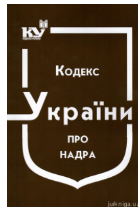
Кодекс України про надра