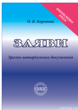
Заяви: зразки нотаріальних документів