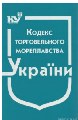
Кодекс торговельного мореплавства України