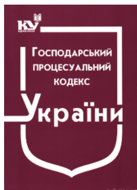
Господарський процесуальний кодекс України