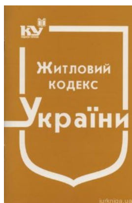
Житловий кодекс України