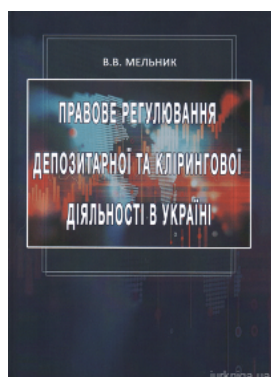
Правове регулювання депозитарної та клірингової діяльності в Україні