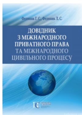
Довідник з міжнародного приватного права та міжнародного цивільного процесу