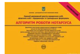
Єдиний державний реєстр юридичних осіб, фізичних осіб-підприємців та громадських формувань. Алгоритм роботи нотаріуса

Перейти до галузі права Нотаріальне право