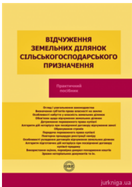
Відчуження земельних ділянок сільськогосподарського призначення