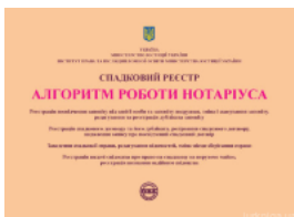
Спадковий реєстр. Алгоритм роботи нотаріуса