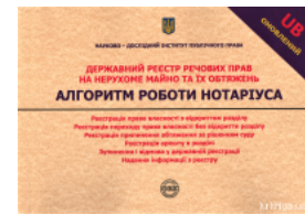
Державний реєстр речових прав на нерухоме майно та їх обтяжень. Алгоритм роботи нотаріуса: практичний посібник