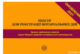
Реєстр для реєстрації нотаріальних дій. Зразки здійснення записів згідно Правил ведення нотаріального діловодства