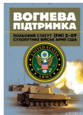
Вогнева підтримка. Польовий статут (FM) 3-09 сухопутних військ армії США