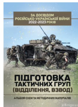
Підготовка тактичних груп (відділення, взвод). Альбом схем та методичних матеріалів