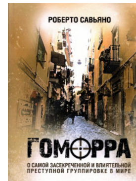
Гоморра. О самой засекреченной и влиятельной преступной группировке в мире