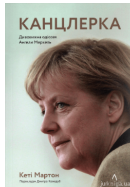
Канцлерка. Дивовижна одісея Ангели Меркель