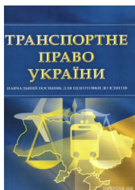
Транспортне право України. Навчальний посібник для підготовки до іспитів