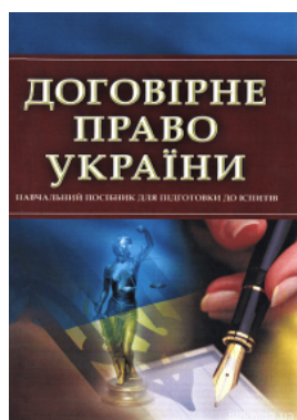
Договірне право України. Навчальний посібник для підготовки до іспитів