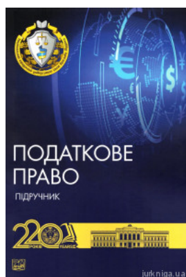
Податкове право. Підручник