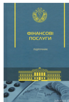
Фінансові послуги. Підручник

Перейти до галузі права Цивільне право та процес