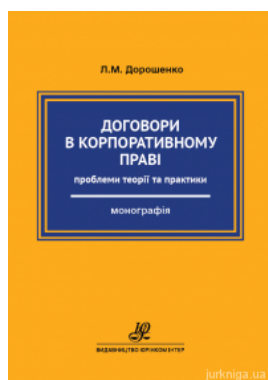
Договори в корпоративному праві: проблеми теорії та практики