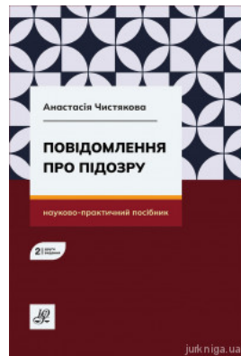
Повідомлення про підозру. Видання друге