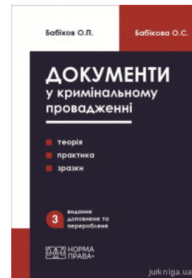
Документи у кримінальному провадженні (теорія, практика застосування, зразки). Видання третє

Перейти до галузі права Кримінальне право та процес