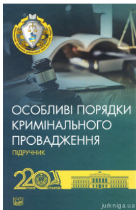
Особливі порядки кримінального провадження. Підручник