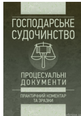
Господарське судочинство. Процесуальні документи. Практичний коментар та зразки