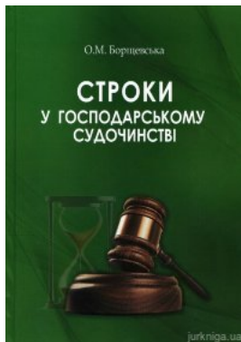
Строки у господарському судочинстві