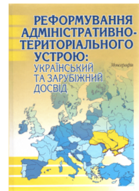
Реформування адміністративно-територіального устрою: український та зарубіжний досвід

Перейти до галузі права Господарське право та процес