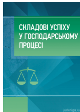
Складові успіху в господарському процесі