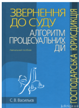
Звернення до суду: алгоритм процесуальних дій (господарська юрисдикція)