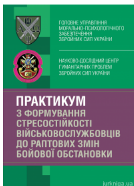
Практикум з формування стресостійкості військовослужбовців до раптових змін бойової обстановки