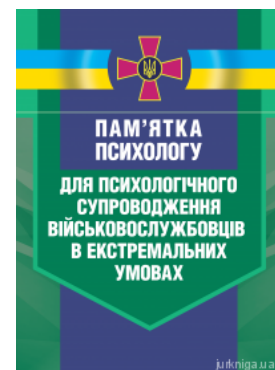
Пам'ятка психологу для психологічного супроводження військовослужбовців в екстремальних умовах