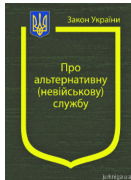
Закон України "Про альтернативну (невійськову) службу"