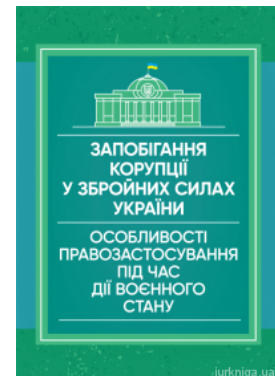
Запобігання корупції у збройних силах України. Особливості правозастосування під час дії воєнного стану