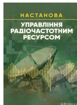
Управління радіочастотним ресурсом. Настанова