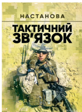
Тактичний зв'язок. Настанова