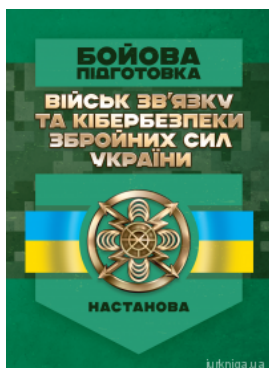
Бойова підготовка військ зв'язку та кібербезпеки Збройних Сил України. Настанова