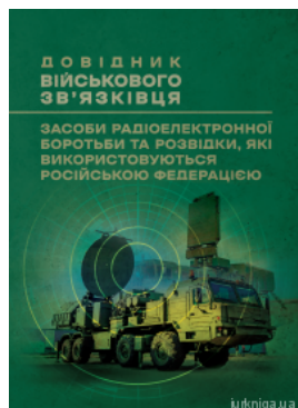
Довідник військового зв'язківця. Засоби радіоелектронної боротьби та розвідки, які використовуються російською федерацією