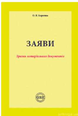
Заяви: зразки нотаріальних документів