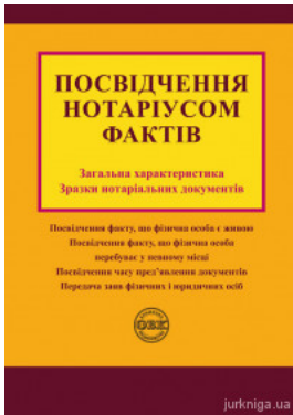
Посвідчення нотаріусом фактів: загальна характеристика, зразки нотаріальних документів