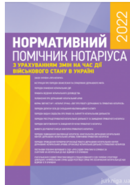
Нормативний помічник нотаріуса 2022