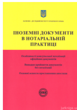
Іноземні документи в нотаріальній практиці