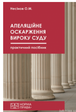
Апеляційне оскарження вироку суду. Практичний посібник