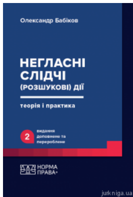
Негласні слідчі (розшукові) дії: теорія і практика. Видання друге