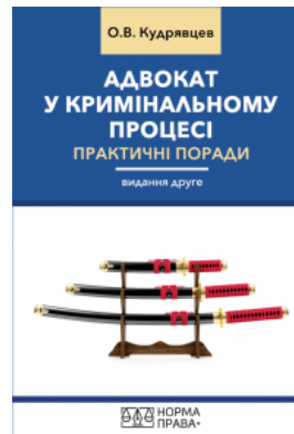
Адвокат у кримінальному процесі. Практичні поради. Видання друге