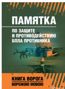
Памятка по защите и противодействию БПЛА противника. Книга врага ворожою мовою