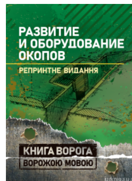
Развитие и оборудование окопов. Книга врага ворожою мовою