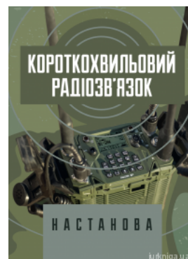
Короткохвильовий радіозв'язок. Настанова