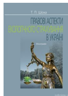
Правові аспекти екологічного страхування в Україні