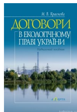
Договори в екологічному праві України