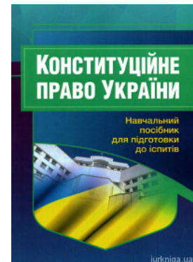
Конституційне право України. Навчальний посібник для підготовки до іспитів