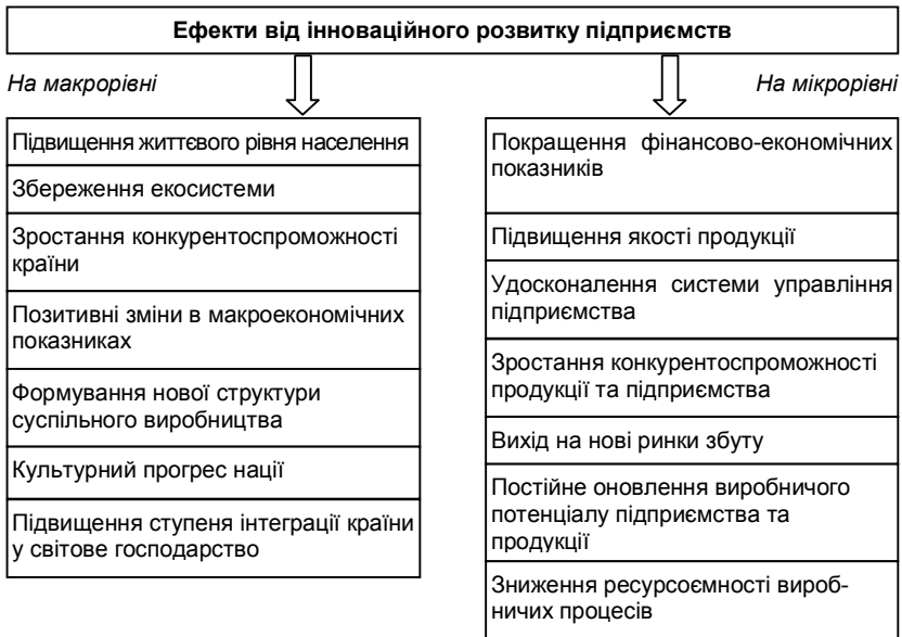
Рис. 1.2. Ефекти впровадження інновацій на макро- та мікрорівнях

послуг), технологій їх виробництва, методів управління на всіх стадіях виробництва та збуту, які сприяють розвитку та підвищенню ефективності функціонування підприємств, що їх використовують.