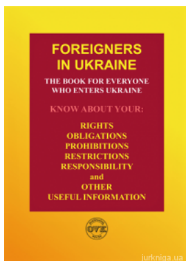
Foreigners in Ukraine

Перейти до галузі права Філософія и психологія права