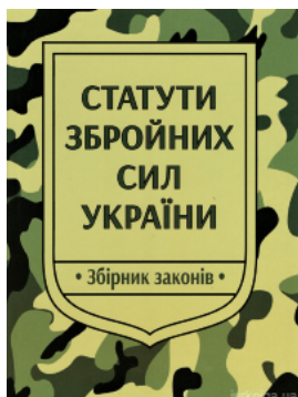
Статути збройних сил України: збірник законів