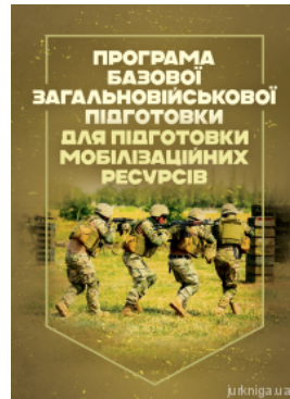
Програма базової загальновійськової підготовки (для підготовки мобілізаційних ресурсів)