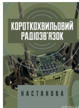
Короткохвильовий радіозв'язок. Настанова