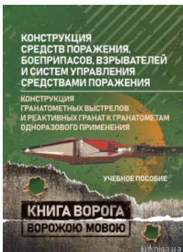
Конструкція средств поражения, боеприпасов, взрывателей и систем управления средствами поражения. Конструкція гранатометных выстрелов и реактивных гранат к гранатометам одноразового применения.