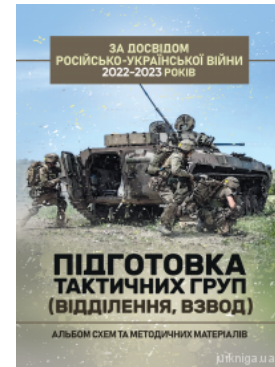
Підготовка тактичних груп (відділення, взвод). Альбом схем та методичних матеріалів