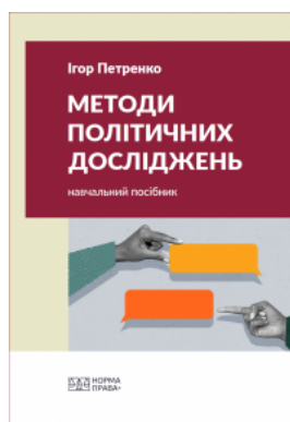
Методи політичних досліджень