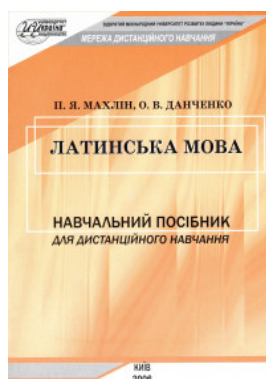
Латинська мова: навчальний посібник для дистанційного навчання