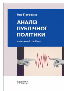
Аналіз публічної політики