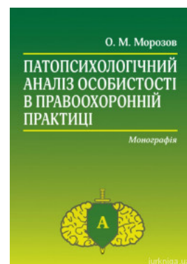
Патопсихологічний аналіз особистості в правоохоронній практиці