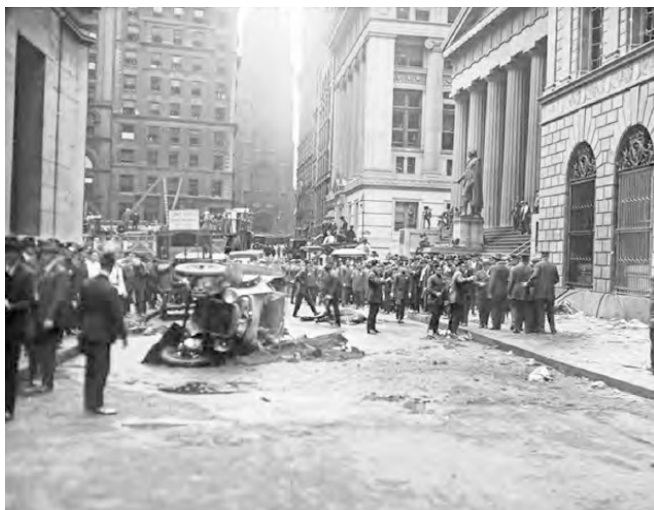
Взрывы в сентябре 1920 г. на Уолл-стрит — теракт, который остался нераскрытым