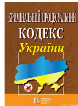
Кримінальний процесуальний кодекс України. Алерта