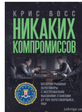
Никаких компромиссов. Бесприигрышные переговоры с экстремально высокими ставками. От топ-переговорщика ФБР