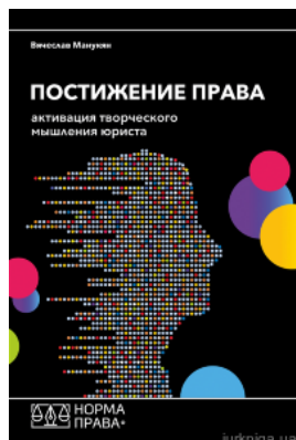
Постижение права. Активация творческого мышления юриста