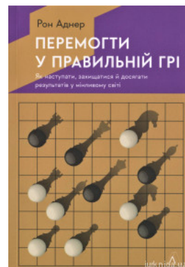
Перемогти у правильній грі. Як наступати, захищатися й досягати результатів у мінливому світі