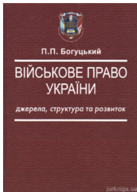
Військове право України: джерела, структура та розвиток