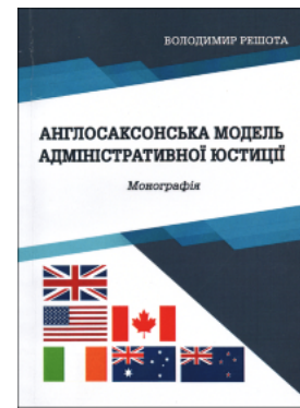
Англосаксонська модель адміністративної юстиції

Перейти до галузі права Административное право