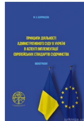
Принципи діяльності адміністративного суду в Україні в аспекті імплементації європейських стандартів судочинства