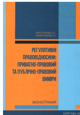
Регулятивні правовідносини: приватно-правовий та публічно-правовий виміри