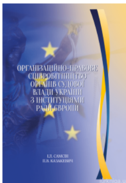
Організаційно-правове співробітництво органів судової влади України з інституціями Ради Європи