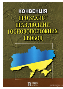
Конвенція про захист прав людини і основоположних свобод. Збірник законодавчих актів. Алерта

Перейти до галузі права Кримінальне право та процес