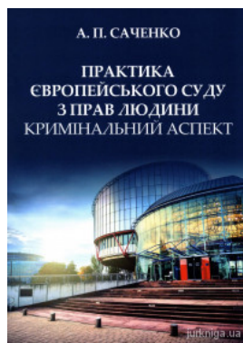
Практика Європейського суду з прав людини. Кримінальний аспект