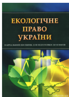
Екологічне право України. Навчальний посібник для підготовки до іспитів