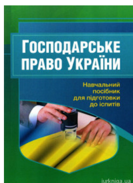
Господарське право України. Навчальний посібник для підготовки до іспитів