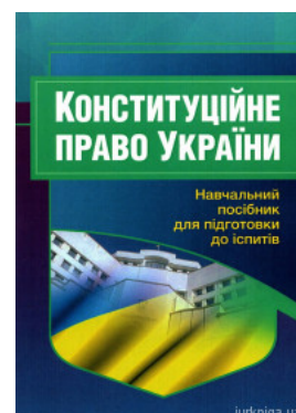
Конституційне право України. Навчальний посібник для підготовки до іспитів