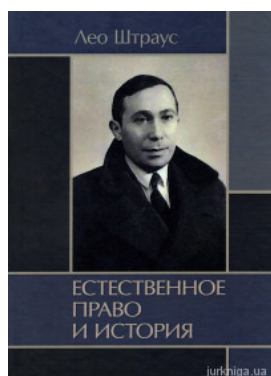
Естественное право и история