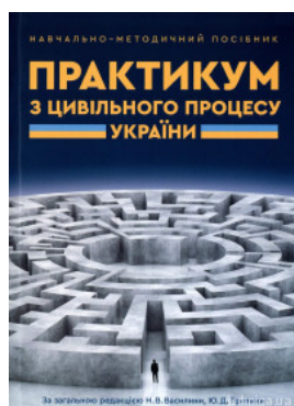
Практикум з цивільного процесу України. Навчально-методичний посібник для студентів юридичних спеціальностей вищих навчальних закладів