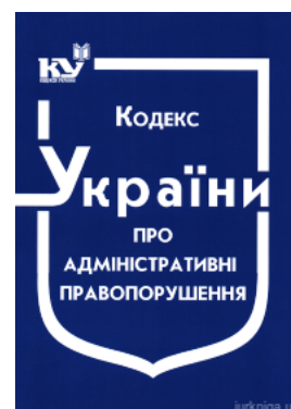
Кодекс України про адміністративні правопорушення