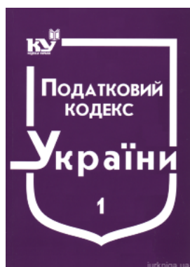
Податковий кодекс України в 2-х частинах