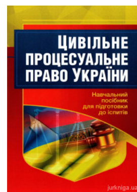
Цивільне процесуальне право України. Навчальний посібник для підготовки до іспитів