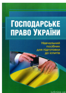
Господарське право України. Навчальний посібник для підготовки до іспитів