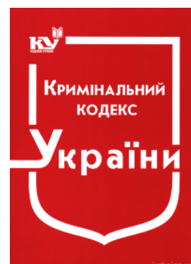
Кримінальний кодекс України