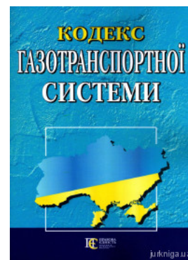
Кодекс газотранспортної системи. Алерта