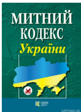
Митний кодекс України. Алерта