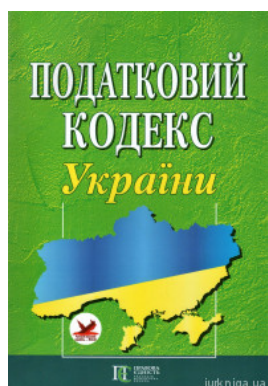
Податковий кодекс України. Алерта