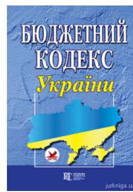
Бюджетний кодекс України. Алерта