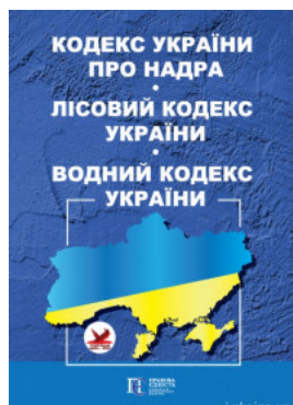
Кодекс України про надра. Лісовий кодекс України. Водний кодекс України. Алерта