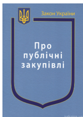
Закон України "Про публічні закупівлі"