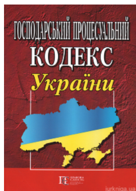
Господарський процесуальний кодекс України. Алерта