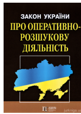
Закон України "Про оперативно-розшукову діяльність". Алерта