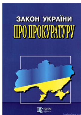
Закон України "Про прокуратуру". Алерта