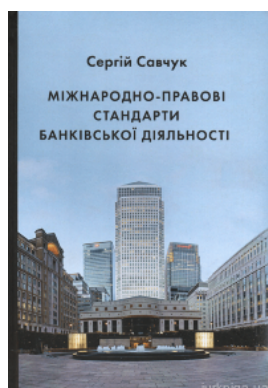
Міжнародно-правові стандарти банківської діяльності