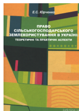
Право сільськогосподарського землекористування в Україні: теоретичні та практичні аспекти