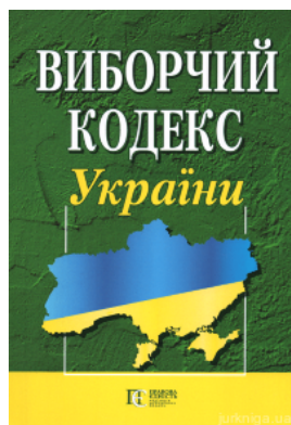
Виборчий кодекс України. Алерта