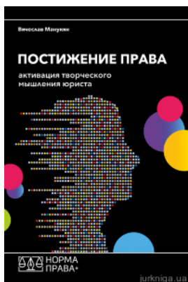
Постигание права. Активация творческого мышления юриста