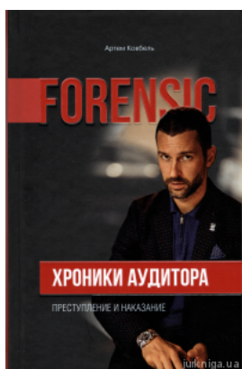
Хроніки аудитора. Форензик - преступлення і наказання