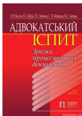
Адвокатський іспит: зразки процесуальних документів