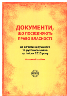
Документи, що посвідчують право власності на об'єкти нерухомого та рухомого майна до і після 2013 року