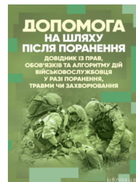
Допомога на шляху після поранення. Довідник із прав, обов'язків та алгоритму дій військовослужбовця у разі поранення, травми чи захворювання