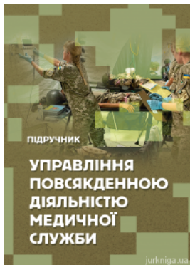
Управління повсякденною діяльністю медичної служби