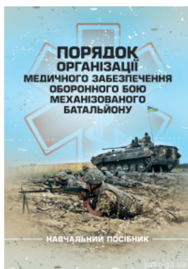
Порядок організації медичного забезпечення оборонного бою механізованого батальйону