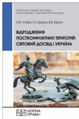
Відродження постконфліктних територій: світовий досвід і Україна