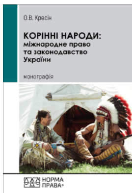
Корінні народи: міжнародне право та законодавство України