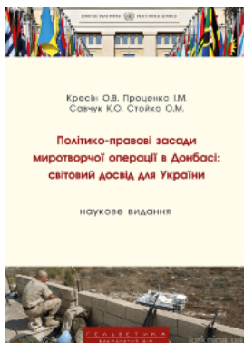
Політико-правові засади миротворчої операції в Донбасі: світовий досвід для України