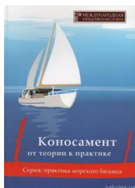
Коносамент: от теории к практике