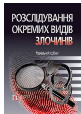
Розслідування окремих видів злочинів. Навчальний посібник