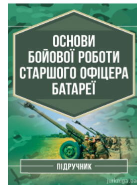
Основи бойової роботи старшого офіцера батареї