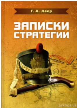
Записки стратегії. Репринтне издание