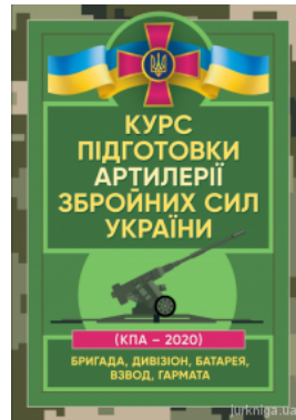
Курс підготовки артилерії Збройних Сил України (бригада, дивізіон, батарея, взвод, гармата)