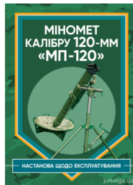
Міномет калібру 120-мм МП-120. Настанова щодо експлуатування