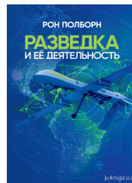
Разведка и её деятельность