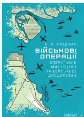
Військові операції: оперативне мистецтво та військові дисципліни