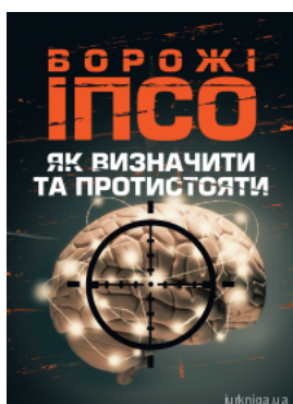
Ворожі ІПСО. Як визначити та протистояти