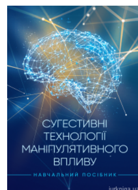
Сугестивні технології маніпулятивного впливу