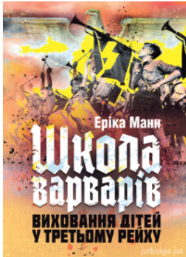
"Школа варварів". Виховання дітей у Третьому Рейху