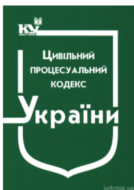
Цивільний процесуальний кодекс України