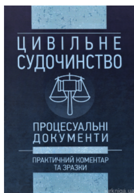
Цивільне судочинство. Процесуальні документи. Практичний коментар та зразки