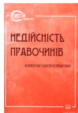
Недійсність правочинів. Коментар судової практики

Перейти до галузі права Господарське право та процес