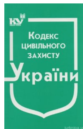
Кодекс цивільного захисту України