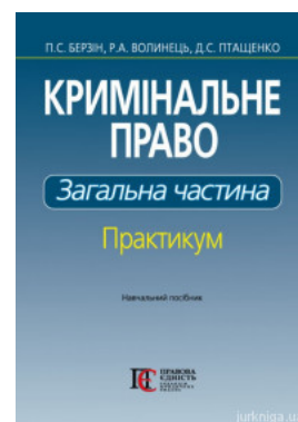
Кримінальне право. Загальна частина. Практикум