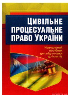
Цивільне процесуальне право України. Навчальний посібник для підготовки до іспитів