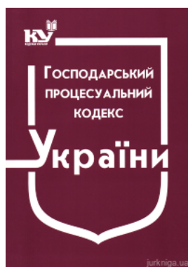
Господарський процесуальний кодекс України