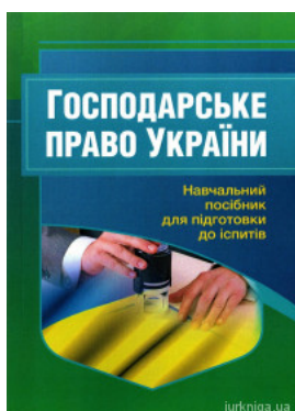
Господарське право України. Навчальний посібник для підготовки до іспитів