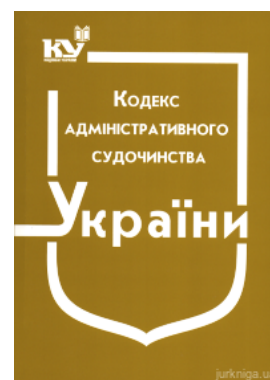
Кодекс адміністративного судочинства України

Перейти до галузі права Господарське право та процес