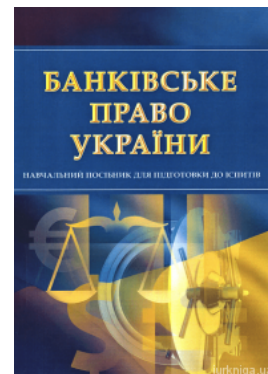
Банківське право. Навчальний посібник для підготовки до іспитів

Перейти до галузі права Господарське право та процес