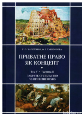
Приватне право як концепт. Том V. Протистояння відкритого та закритого суспільств і приватне право (Частина II. Закрите суспільство vs приватне право)