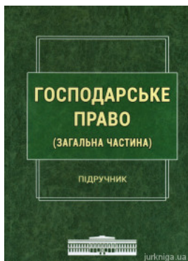
Господарське право (загальна частина)