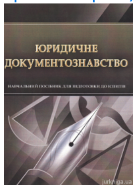
Юридичне документознавство. Навчальний посібник для підготовки до іспитів