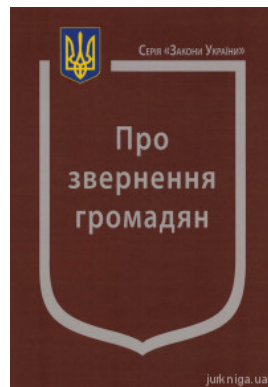
Закон України "Про звернення громадян"